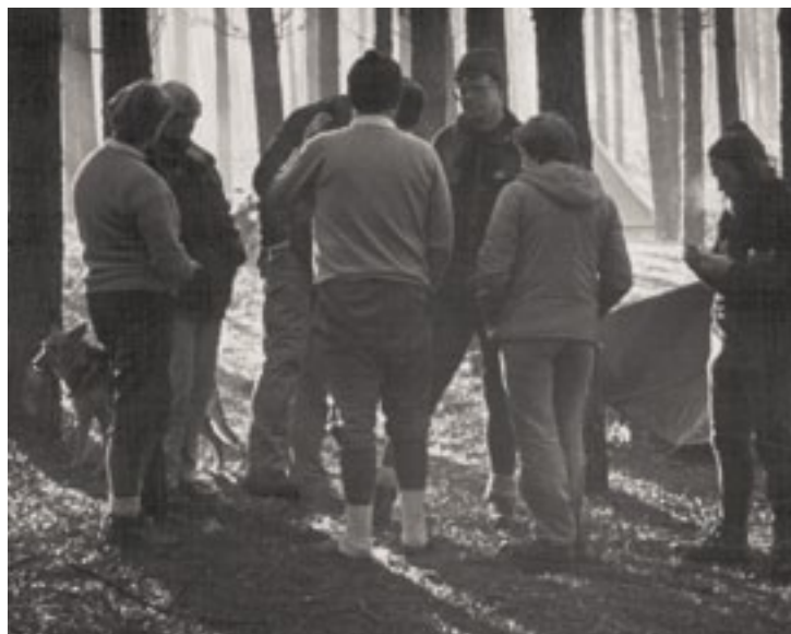
Decemberkamp Dorst 1983

8 Jaar oud, wij woonden in Rijswijk ZH en de Verkennerij kampeerde op 'Overvoorde'. Gelegen in een spannend bos met open plekken. Hier is mijn passie voor het kamperen geboren. Geleerd van oudere verkenners, samen optrekken, tent opzetten, slapen in een tent, tafel pionieren, thee zetten, groenten koken en aardappelen koken of poffen op houtvuur. Later, in Haarlem, overgevlogen van de welpen naar de verkenners. Letterlijk bijna vliegen, langs touwladders en slingerpalen 15 meter omhoog om bij de patrouille de 'Sperwers' te komen. Met die groep veel opgedaan, vanaf het voorjaar bijna elk weekend op de fiets naar de Heerenduinen in Velsen Zuid en zomers met de bus naar de Malpie in Brabant.