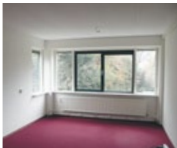
De ruimte voor de clubadministratie

Onze ruimten bevinden zich op de eerste verdieping. We hebben de beschikking over drie kamers van 3,60 bij 5,10 m.