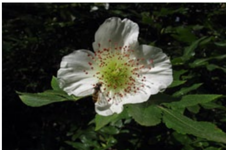
Afbeelding 2: correctie -1

gie om een gemiddeld belichte opname te maken. Het gemiddelde van alle waargenomen licht, de donkere gedeelten en de lichte gedeelten, bepalen het resultaat en de belichting. Gevolg is dat bij een foto in een overwegend donkere omgeving meer licht zal worden toegelaten waardoor de foto te licht zal worden, en bij een overwegend lichte omgeving te weinig licht met als gevolg een te donkere foto. Resultaat: de witte paddenstoel, of die mooie witte bloem, in een overwegend donkere omgeving wordt overbelicht en in die verblindend,