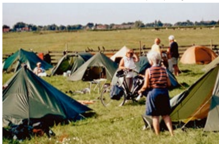
Kamperen op de Engewormer 2006