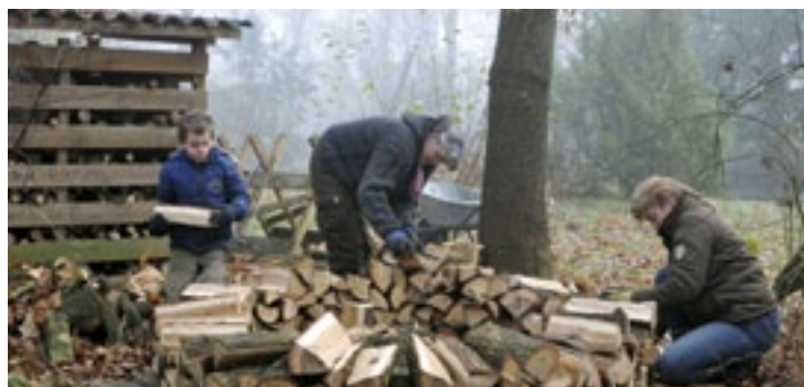
Houtmijt in aanbouw

Beeldhouwen met de kettingzaag November is de maand van het Houtvesterskamp, 19 en 20 november stonden bomen en hout centraal en natuurlijk ook het kamperen in koude omstandigheden. Niks tent naar zolder, maar gewoon opzetten op De Hertenweide in het Nationale Park Drents-Friese Wold. Zaterdag kon je er beeldhouwen met de motorzaag en zelf bomen omzagen. Zondag werd er hout gekloofd en een grote houtmijt gebouwd. Het is een mooi weekendje 'bevorderen kamperen en clubben' geworden; lekker weg in eigen land en even heel wat anders. De Hertenweide is in de Herfst op z'n mooist. Met een tapijt van bla-