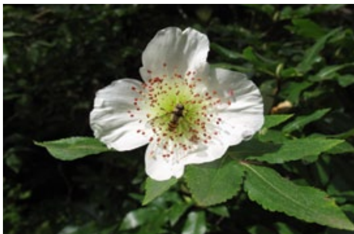
Afbeelding 1: correctie -1/3

Laten we er samen een goede start van een volgende eeuw van maken.